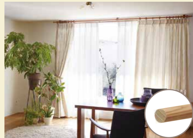
チェリー色：高級家具の材で落ち着きのある赤味が特徴です