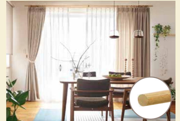
オーク色：上品な黄色味が特徴で北欧家具に多い材の色です