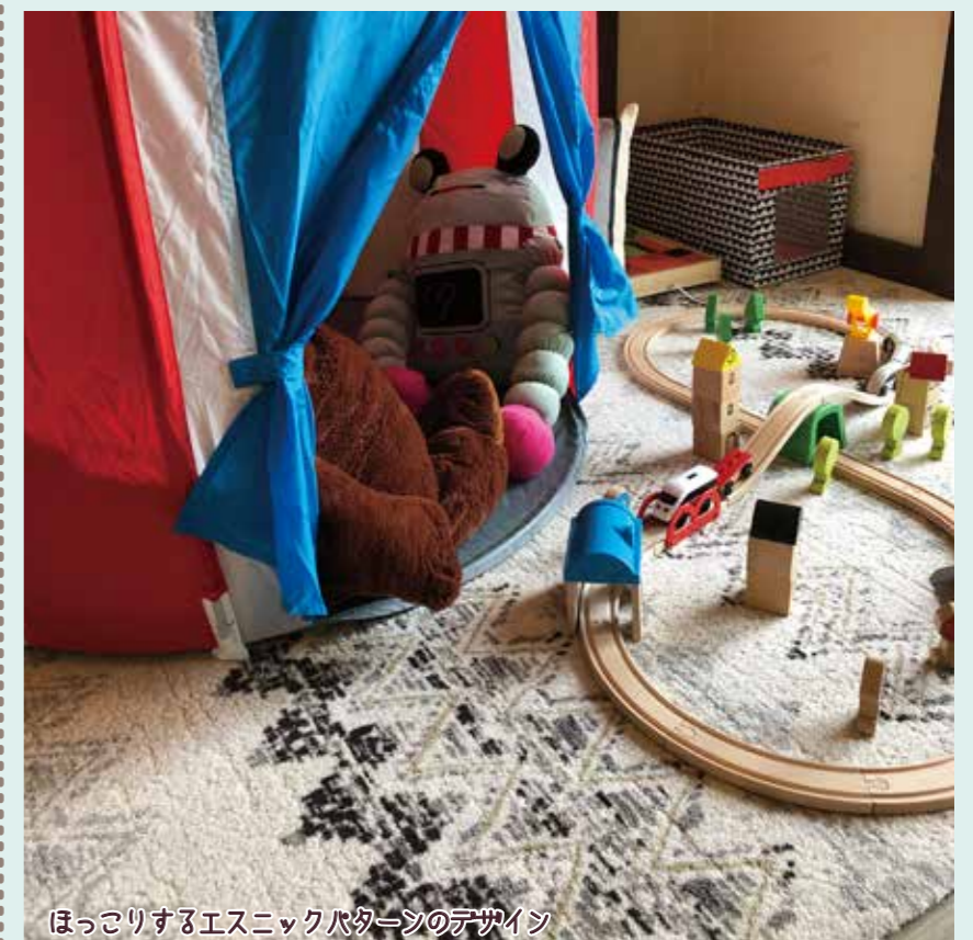
ほっこりするエスニックパターンのデザイン

川島織物セルコン新商品のユニットラグのご紹介です。ユニットラグは、500mm×500mmサイズのタイル状のカーペット。並べて敷くだけなのでとても簡単です。6枚セットで写真は2セット12枚を並べて、キッズコーナーに使っています。例えば、汚れてしまったとしても1枚は500mm角なので、汚れたものだけを取り外して洗っていただくことも可能です。こちらは、同じデザインのカーテンもあるので、カーテンとコーディネートもできますよ。