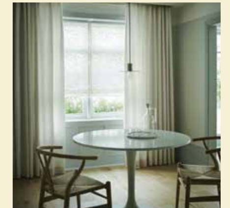
リーフパターンの透け感が美しい シェードと無地カーテンの組み合わせ