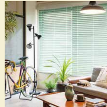
ヴィンテージ加工している やさしいブルーグリーンカラー