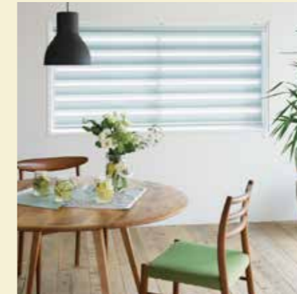
光を採り込める調光ロールスクリーン