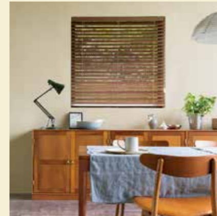
アンティーク調木製ブラインド

カフェに行くのが好きな人は、コーヒー好きという方もいらっしゃると思いますが居心地が良くリラックスできるからなのではないでしょうか？自宅をカフェのようなくつろぎの空間にしたい！カフェ風インテリアが人気なのも納得ですね。今、流行りのカフェ風インテリアはナチュラルなスタイルです。例えば、家具は存在感のある木製やレザーなどの自然素材に、アイアンなどの異素材でコントラストをつけることで今風のカフェ風インテリアイメージに。窓廻りはブラインドなどシンプルなスタイルが思い浮かびますが、カーテンも素材感のあるものは相性がいいですよ。