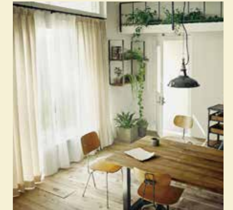
カーテンは素材感のある無地で