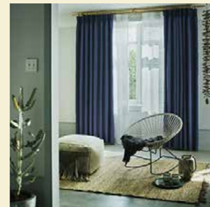
リビングにもブルー系カーテンは人気