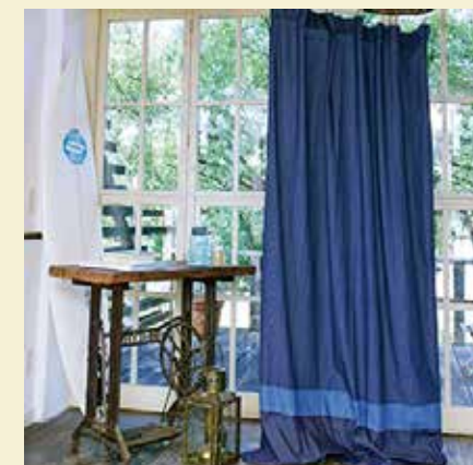
ショップでも人気のデニムカーテン