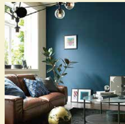
落ち着いた印象の壁紙

パントン社はクラシックブルーについて、シンプルでエレガントな色であり「夕暮れの色」を連想させると表現します。このタイムレスなブルーは、安心感を与えつつも思考を刺激し、わたしたちが新しい時代への入り口を超える時に信頼できる安定した基盤を持ちたいという欲求を浮かび上がらせるということです。ブルーは空・海を連想させます。また、心理的效果としては鎮静作用があるとされています。現代は、テクノロジーにより多くの情報に晒されることによる疲弊を多くの人々が感じているのではないのでしょうか。そんな現代において、クラシックブルーが人間の精神に穏やかで安定した感覚をもたらすことで、集中力や思慮深さへと導いてくれるかもしれません。