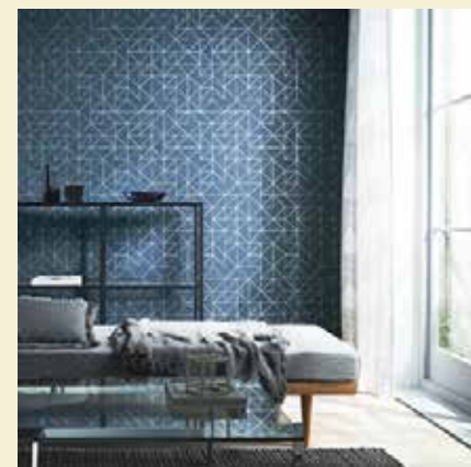
幾何学模様が星空を連想させる