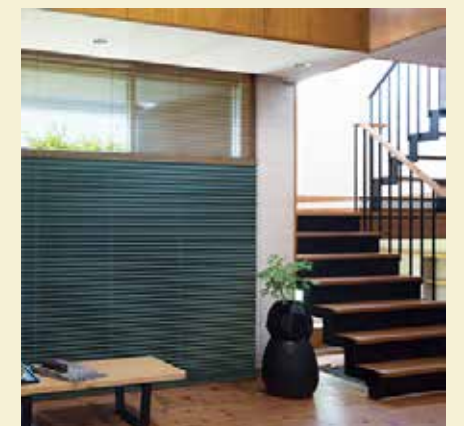
フリーツクスクリーンのブルー