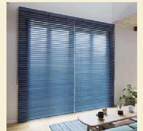
こちらは珍しいブルーの木製ブラインド