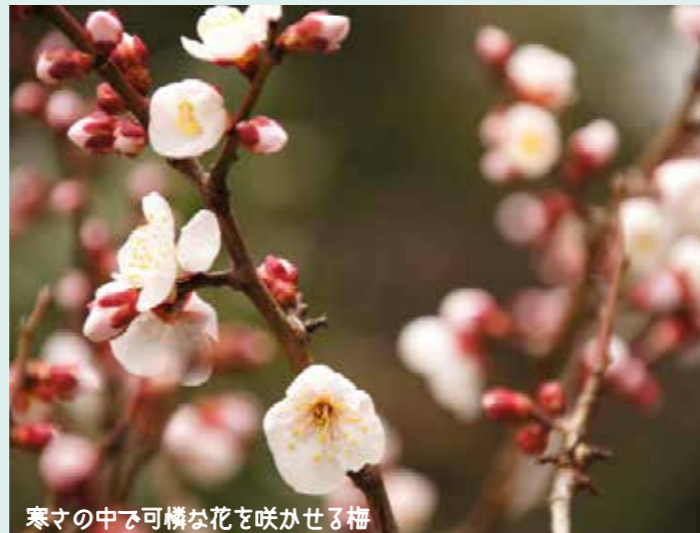
寒さの中で可憐な花を咲かせる梅

朝晩はまだ寒さを感じる日が多くありますが、日中の陽射しに春を感じるようになってきました。梅も見頃となってきました。梅の花は種類も豊富で、色も白い白梅から鮮やかなピンクの紅梅まで様々な色や形があります。品種によって開花時期がずれているので、何種類もの梅の木が植えられている場所では時間差で長く楽しむのも嬉しいですね。春はもうすぐと思っていると、突然寒い日があったりするので体調にはくれぐれもお気をつけください。特に乾燥しているこの時期はインフルエンザや新型コロナウイルスの感染予防にも気を付けましょう。帰宅したら、まず手洗い＆うがいをお忘れなく。