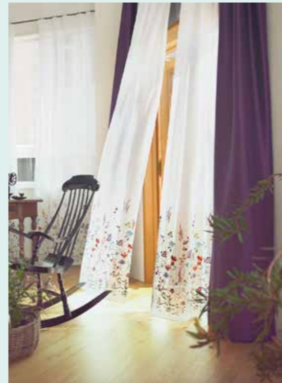
(↑) ショップで人気の刺繍レースカーテン。カラフルな花々が繊細な刺繍で表現されています。厚手カーテンとコーディネートする場合は、刺繍系に使われている色のカーテンと合わせるのがおすすめです。(↓)下は植物柄を水彩風に表現した遮光生地のシェードスタイルです。